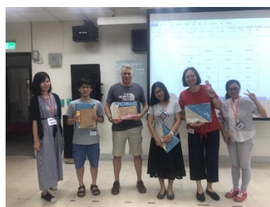
勝利組與隊輔合影