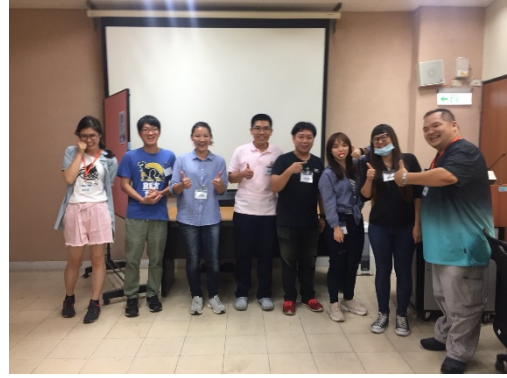
第二關組員與關主合影