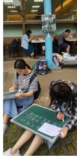
大家聚精會神地寫著板書(板書比一比)