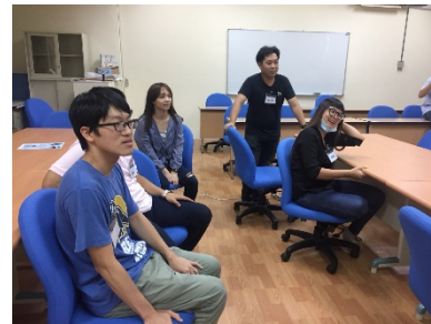
第三關成員腦力激動中