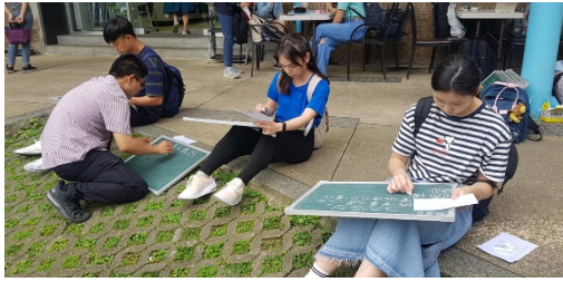
大家融入大自然中撰寫板書(板書比一比)